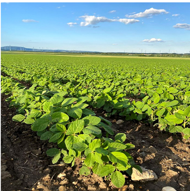
Sojafeld Ende Juni nahe bei Wien.

Die GUSTINO-LandwirtInnen sind VorreiterInnen und setzen auf regionale und entwaldungsfreie Futtermittel. GUSTINO-Strohschweine „Klimafit“ wachsen auf österreichischen Familienbetrieben auf, fressen ca. 80% hofeigenes Futter wie Gerste, Weizen, Ackerbohne und Mais. Auch der kritische Sojaschrot stammt aus regionaler oder europäischer Produktion: Seit 2018 erhalten GUSTINO-Strohschweine „Klimafit“ als Eiweißfuttermittel überwiegend Donau Soja-zertifizierte Futtermittel.