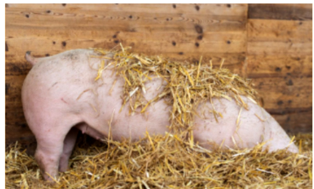
GUSTINO-Strohschweine „Klimafit“ erhalten regionales gentechnikfreies Donau Soja

Die Europäische Union bezieht etwa 40% ihrer Soja-Importe aus Brasilien. Dieser Import wird überwiegend als eiweißreiches Futtermittel in der Nutztierproduktion eingesetzt. Sojafuttermittel aus dem Amazonasgebiet oder dem Cerrado sind wegen der Landumwandlungen mit relativ hohen CO 2 -Emissionen belastet. Dadurch ergibt sich für Soja aus diesen Gebieten ein etwa 10-mal höherer CO 2 -Fußabdruck als für Donau Soja / Europe Soja-zertifizierte europäische Sojafuttermittel.